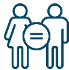
Equidad de género