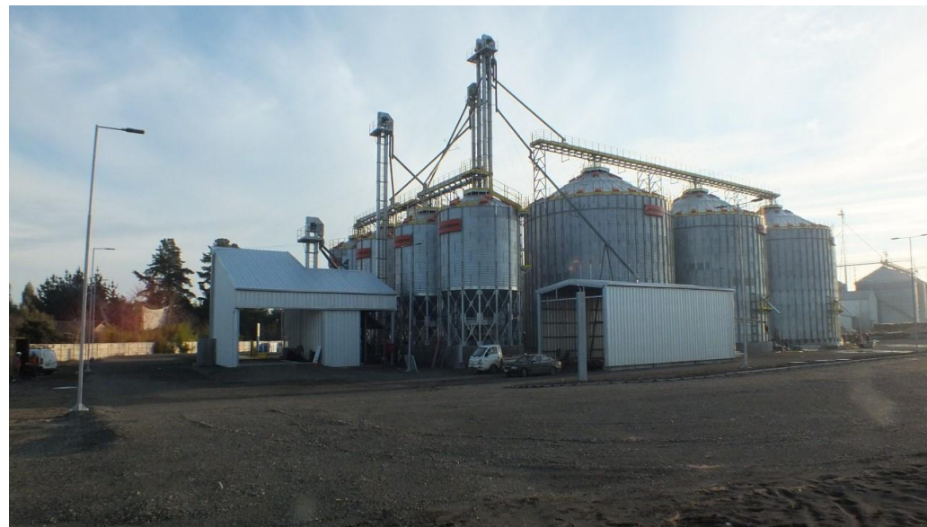
Planta de silos Los Ángeles.